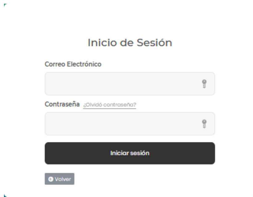
Figura 3. Formulario de inicio de sesión.